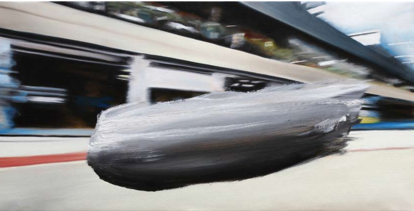
Line/line , 2017 Öl auf Leinwand oil on canvas 50 x 100 cm