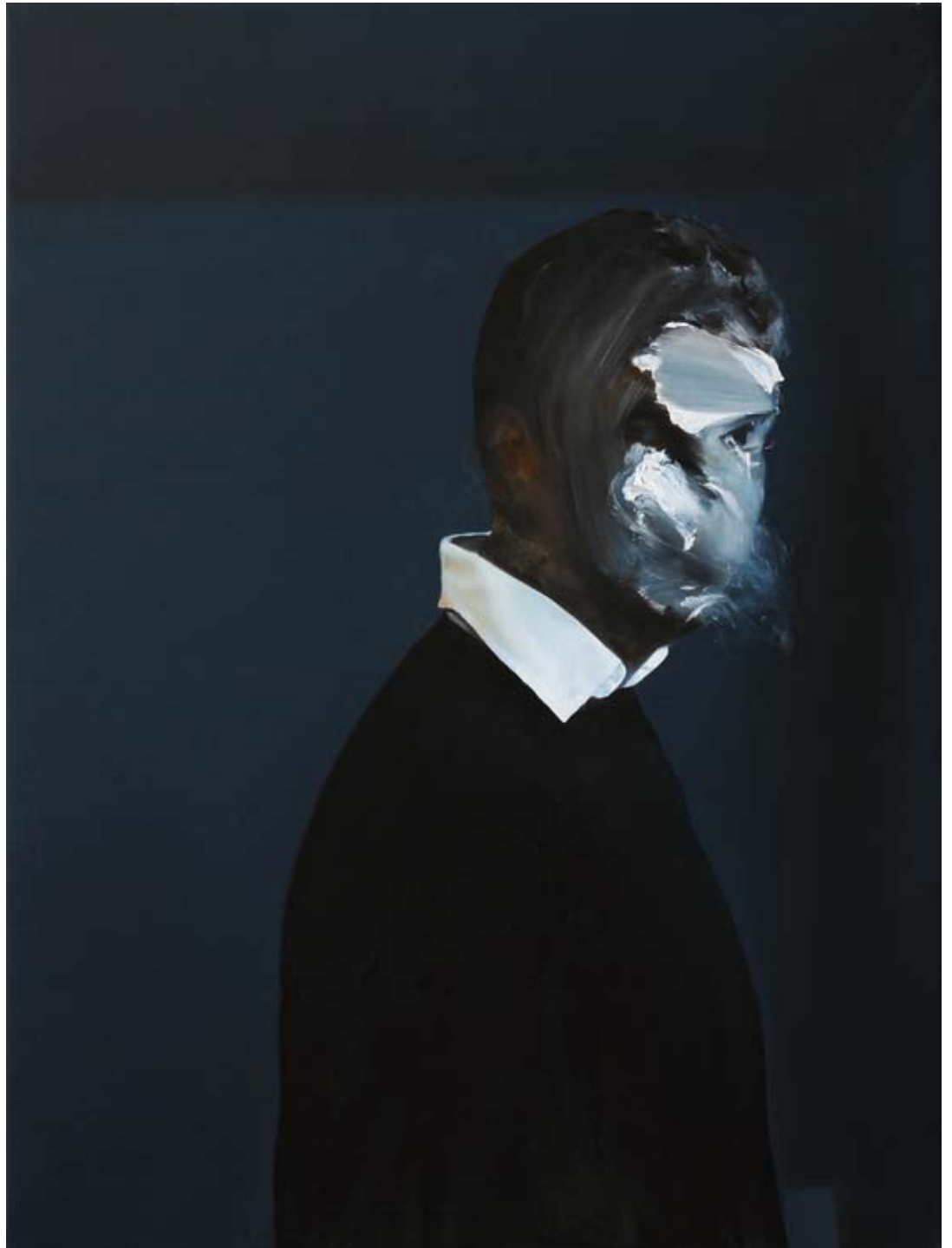
Idol (Warteraum)/ idol (waiting room) , 2017 Öl auf Leinwand oil on canvas 120 x 90 cm