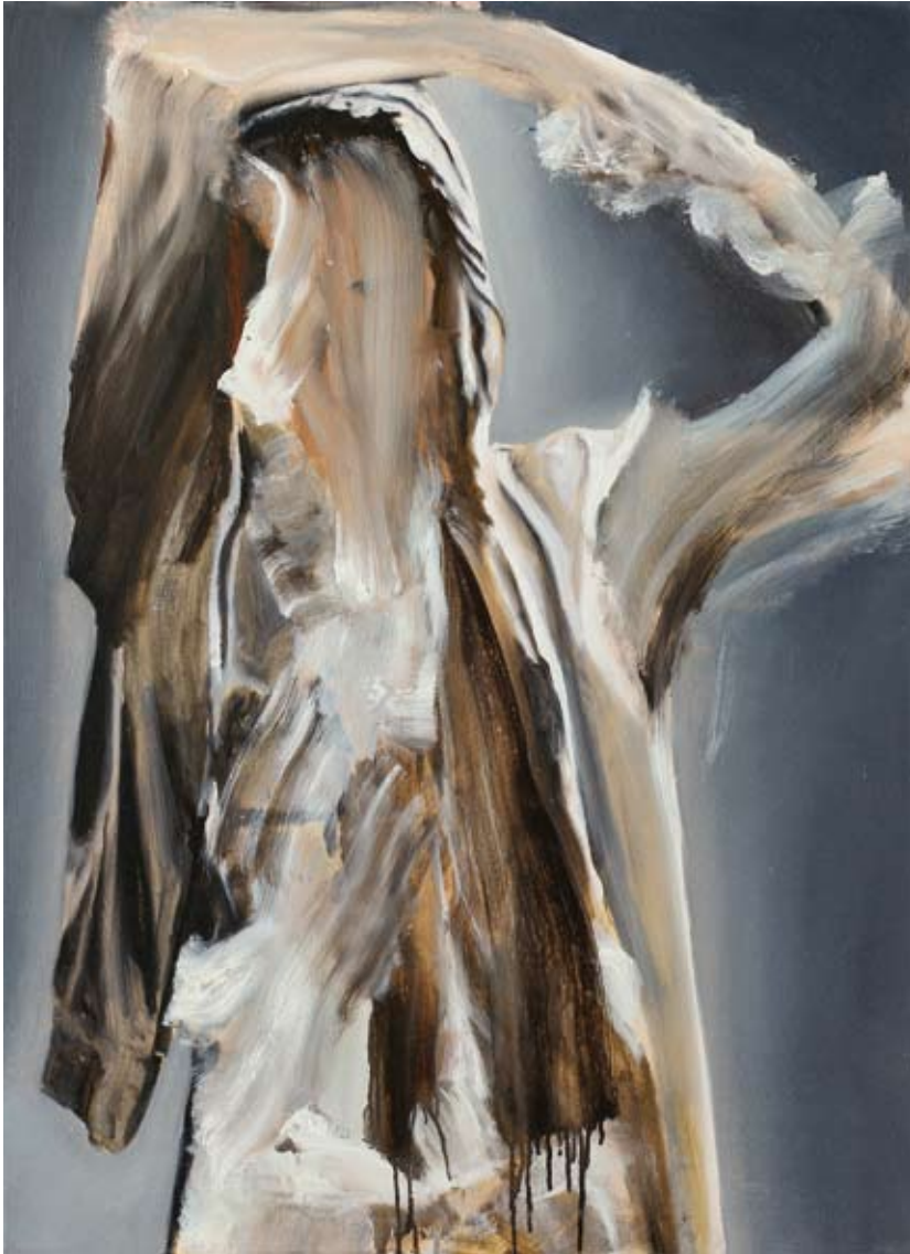
Drehung/rotation , 2017 Öl auf Leinwand oil on canvas 110 x 80 cm