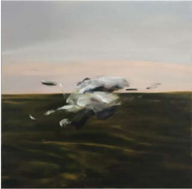
blur/blur , 2018 Öl auf Leinwand oil on canvas 60 x 60 cm