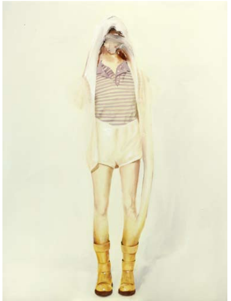
Model/model , 2018 Öl auf Leinwand oil on canvas 80 x 60 cm