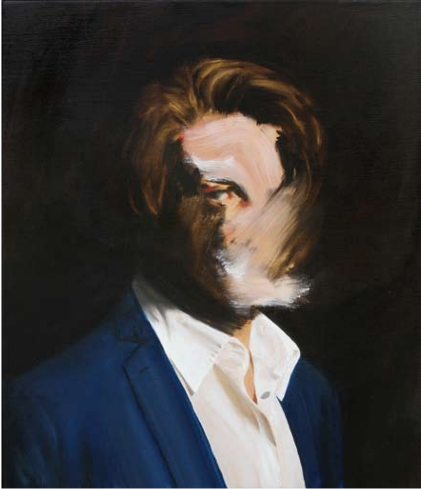
Er/he , 2017 Öl auf Leinwand oil on canvas 70 x 60 cm