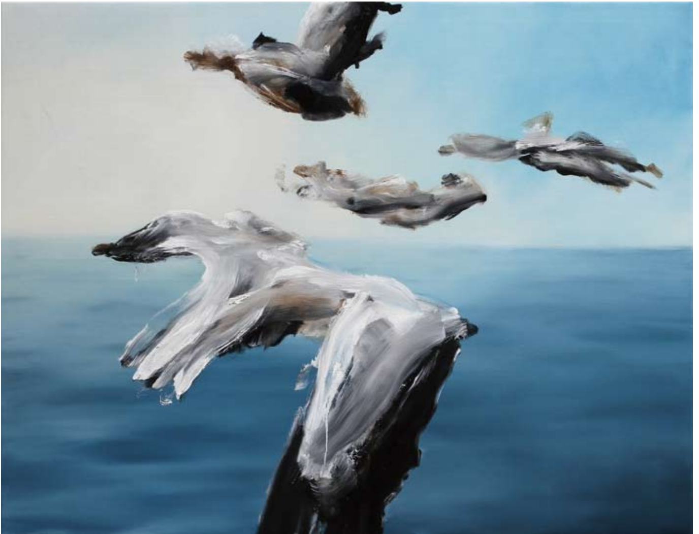
Schwarm/ flock , 2017 Öl auf Leinwand oil on canvas 130 x 100 cm