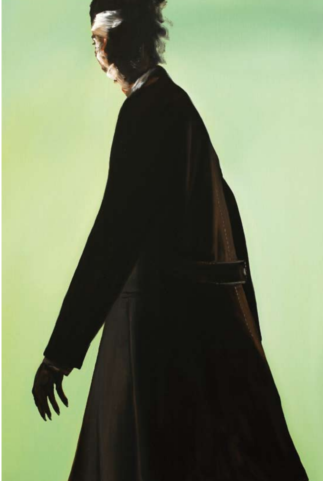
Idol/idol , 2017 Öl auf Leinwand oil on canvas 150 x 100 cm