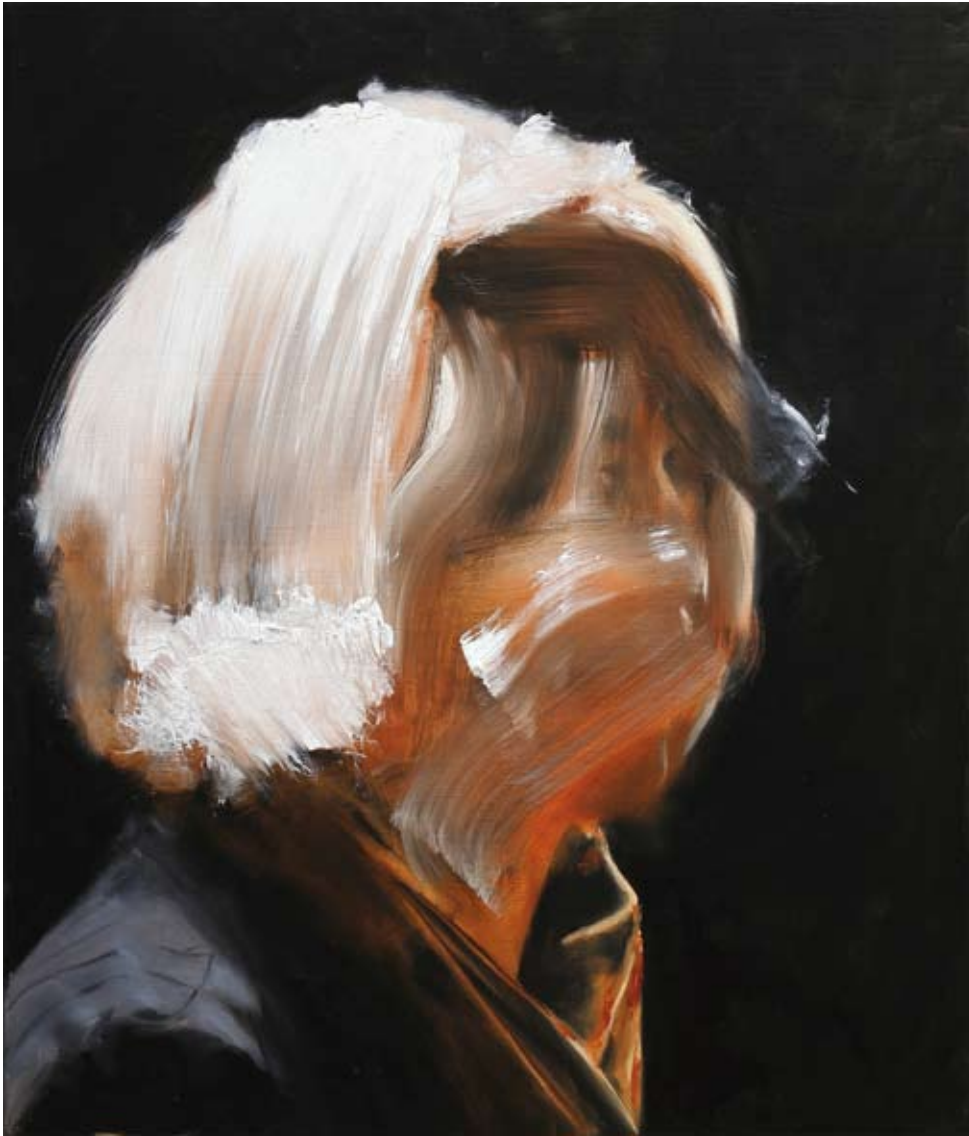
Model/model, 2017 Öl auf Leinwand oil on canvas 70 x 60 cm