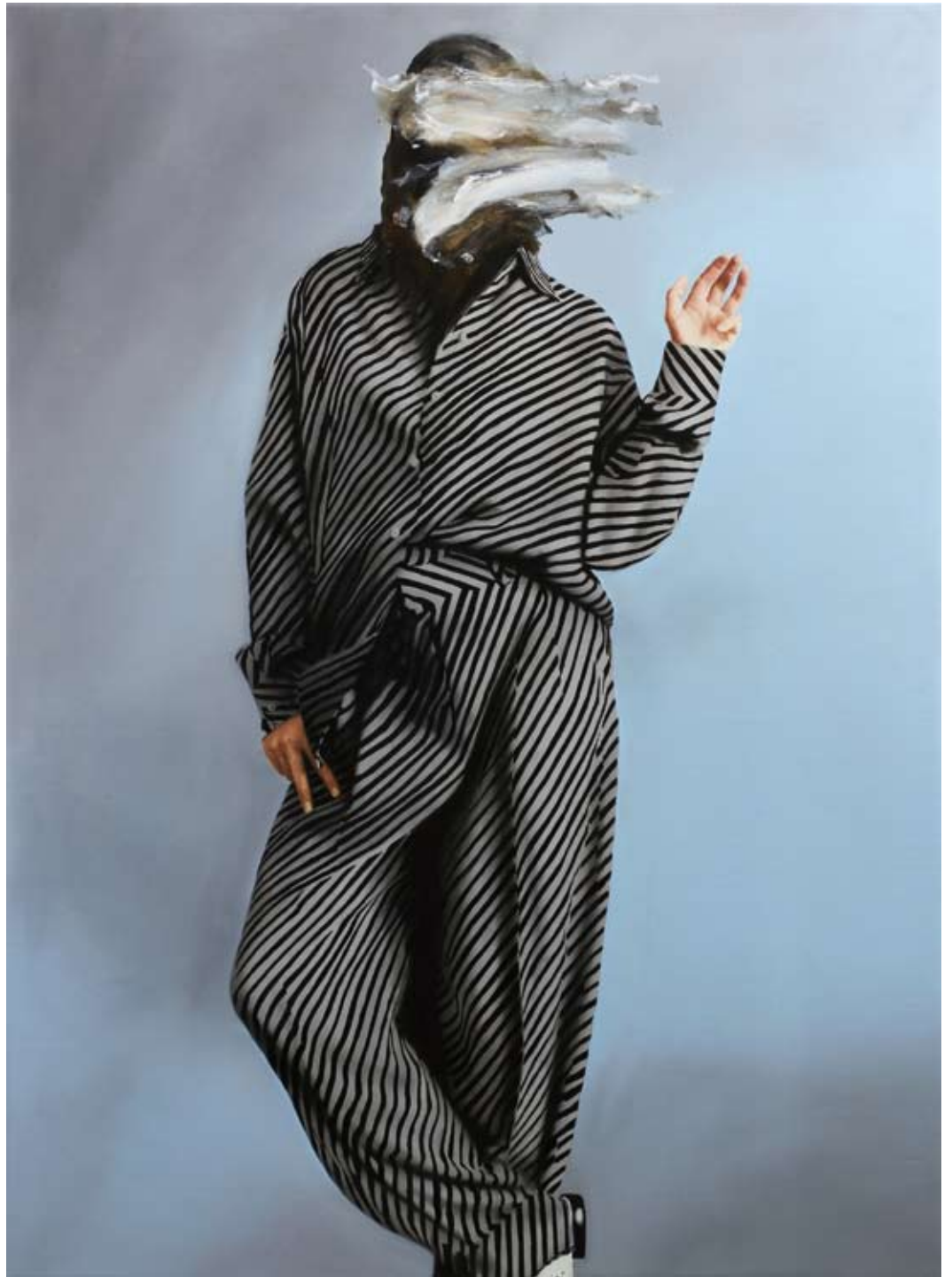
Idol/idol , 2018 Öl auf Leinwand oil on canvas 150 x 110 cm