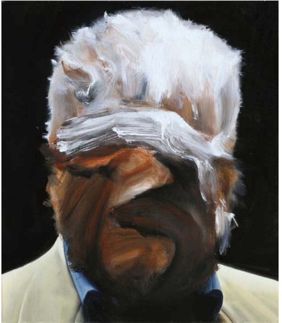
Model/model , 2018 Öl auf Leinwand oil on canvas 70 x 60 cm