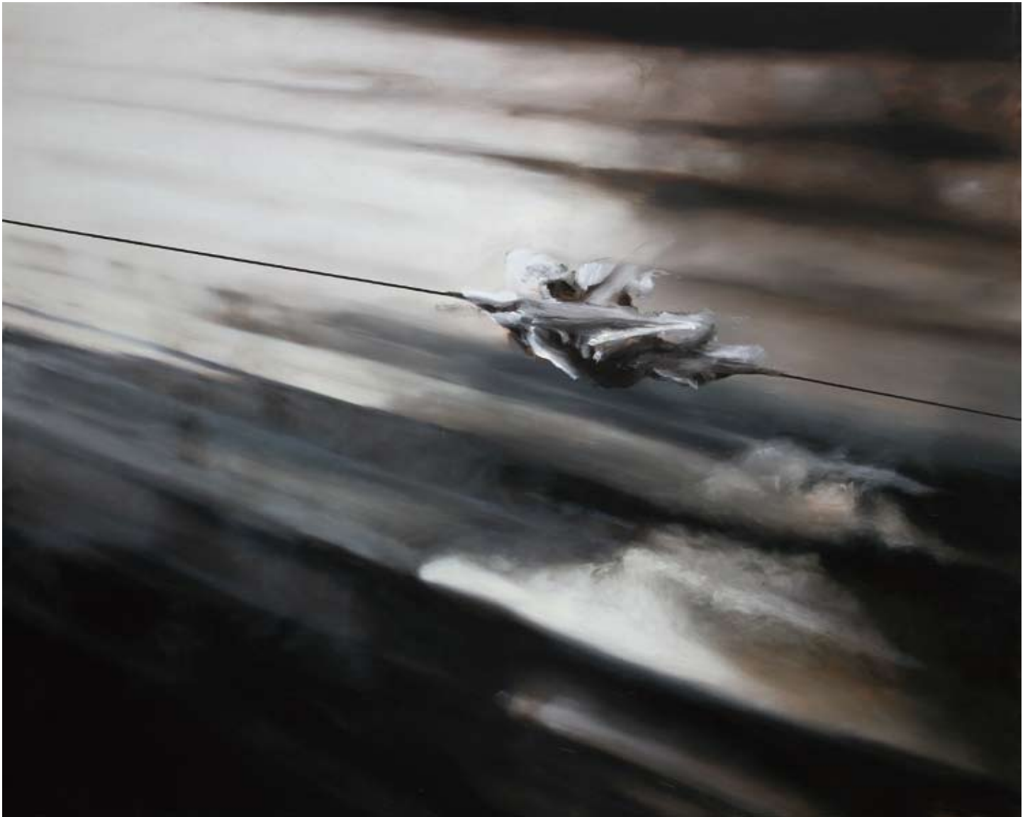
Entität/ entity , 2017 Öl auf Leinwand oil on canvas 200 x 250 cm