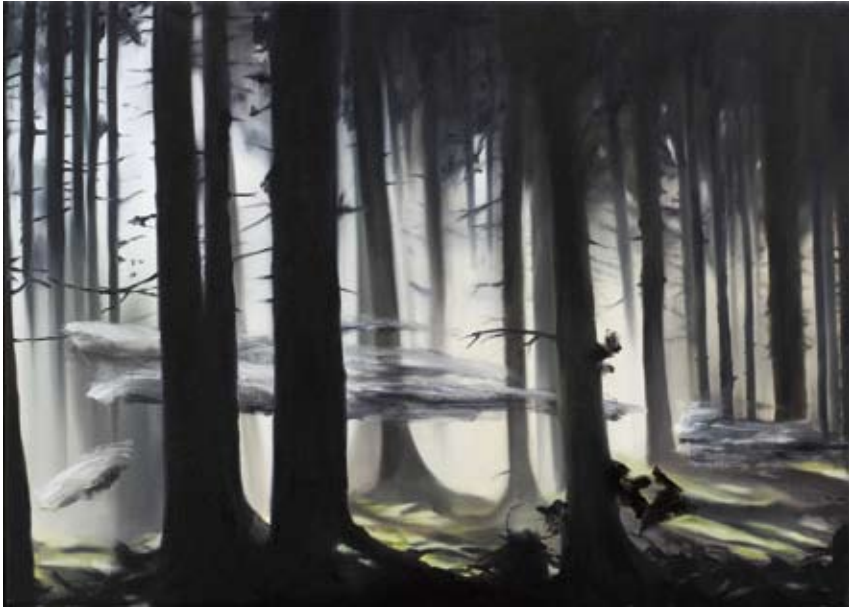
Loach/ loach , 2018 Öl auf Leinwand oil on canvas 50 x 70 cm