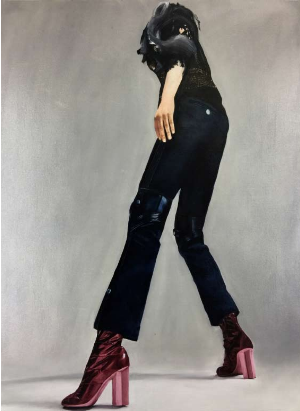
Idol/idol , 2019 Öl auf Leinwand oil on canvas 150 x 110 cm