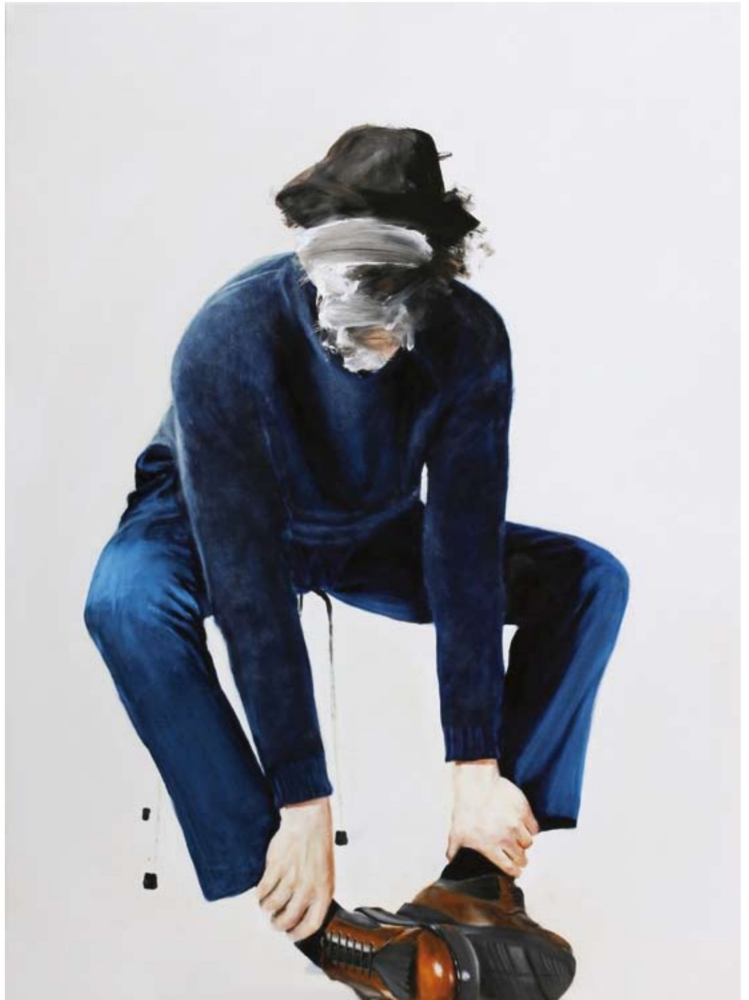
Idol/idol , 2017 Öl auf Leinwand oil on canvas 150 x 110 cm