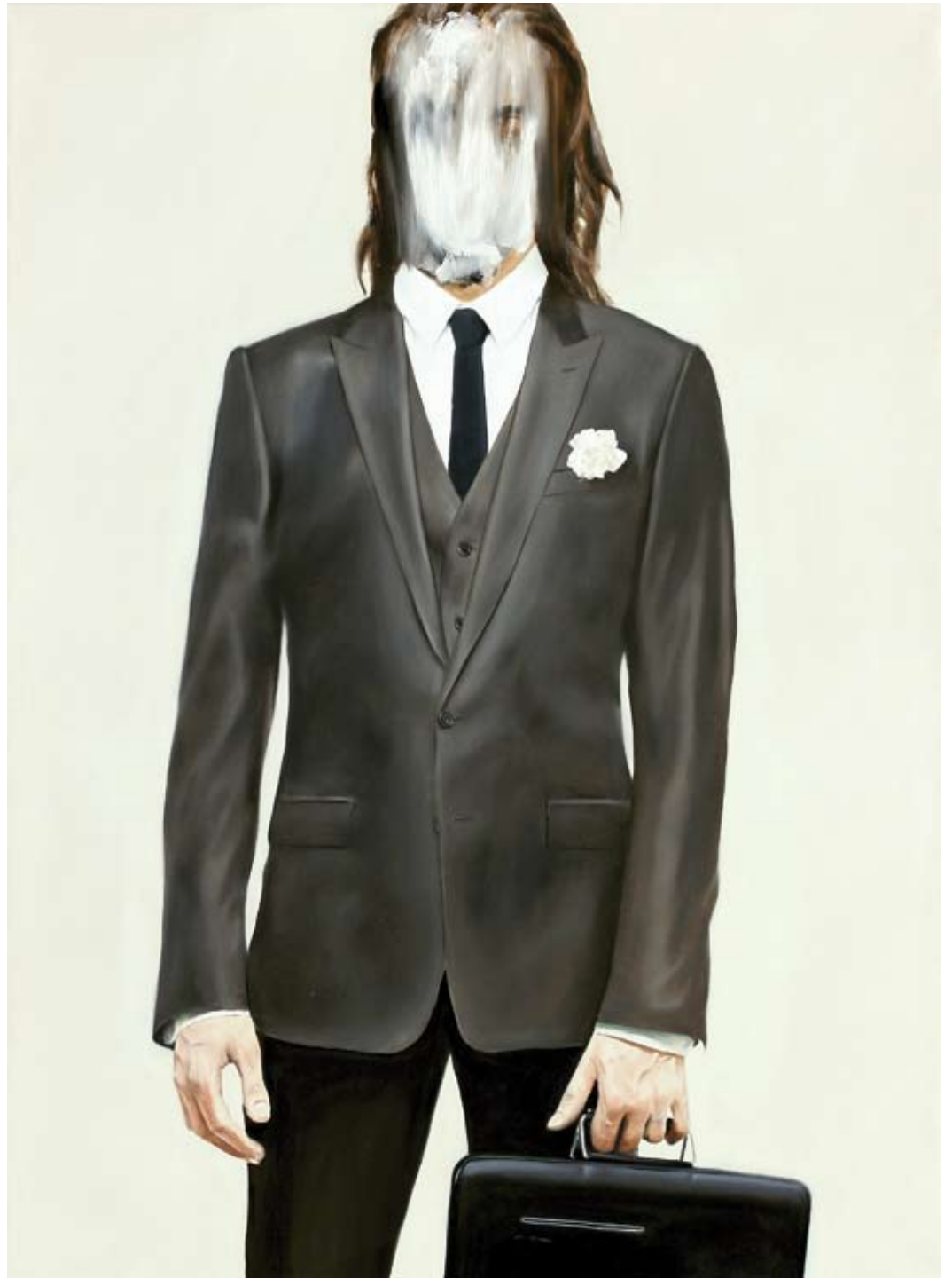
Idol/idol , 2018 Öl auf Leinwand oil on canvas 150 x 110 cm