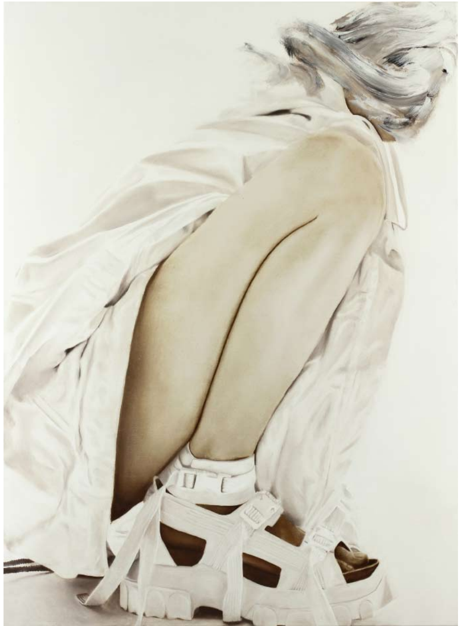
Idol/idol , 2019 Öl auf Leinwand oil on canvas 110 x 80 cm