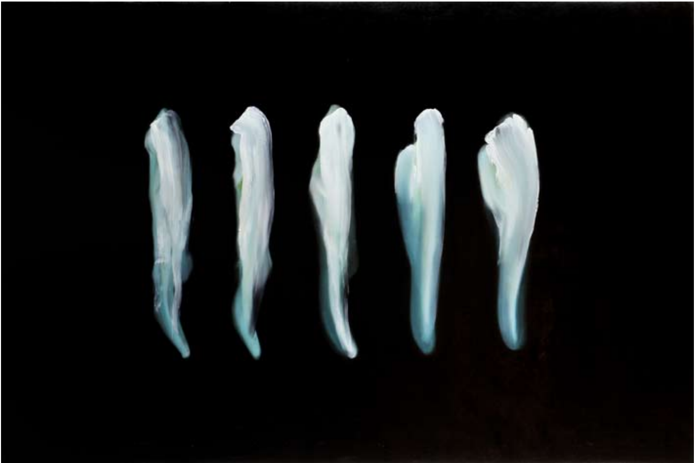
Gehänge (Fünf)/ hanging (five) , 2019 Öl auf Leinwand oil on canvas 100 x 150 cm