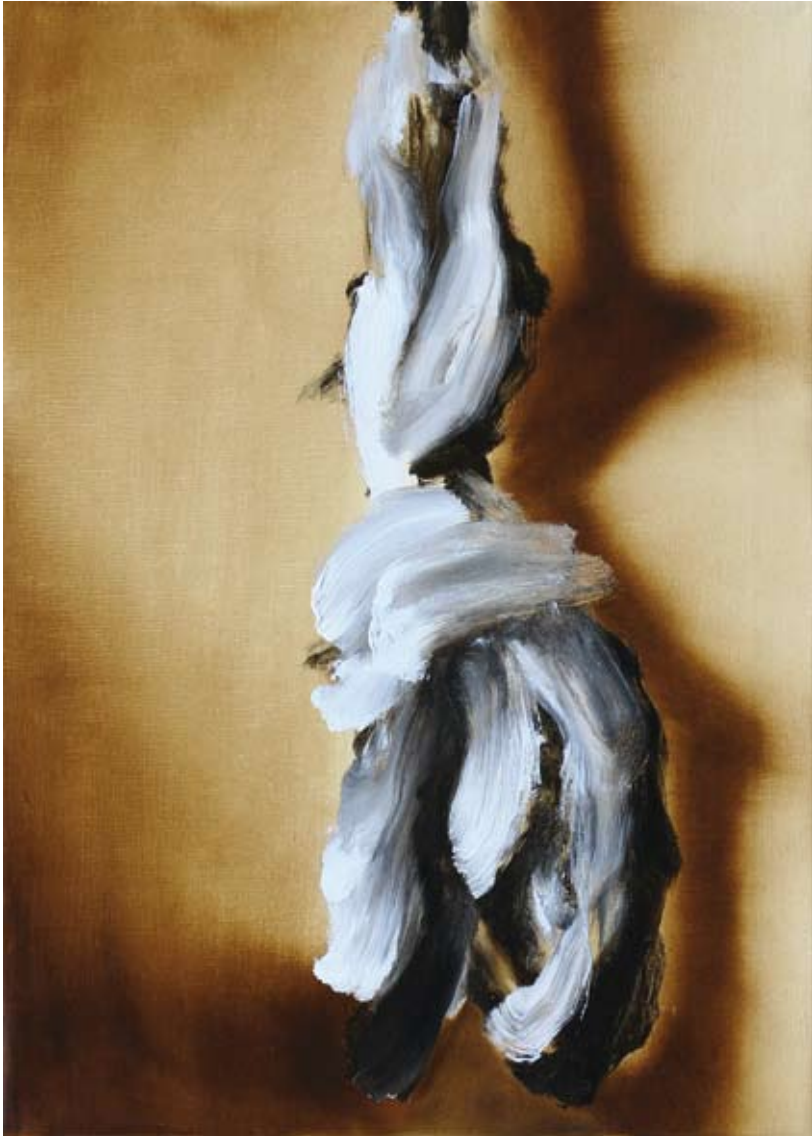
Gehänge/ hanging , 2018 Öl auf Leinwand oil on canvas 70 x 50 cm