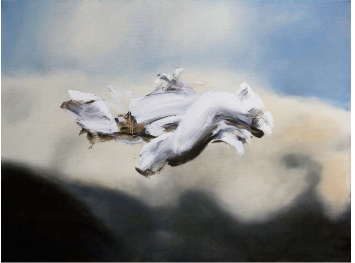
Blur/blur , 2016 Öl auf Leinwand oil on canvas 90 x 120 cm