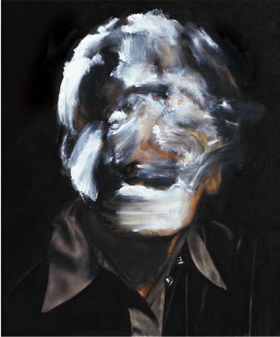
Model/model, 2018 Öl auf Leinwand oil on canvas 60 x 50 cm