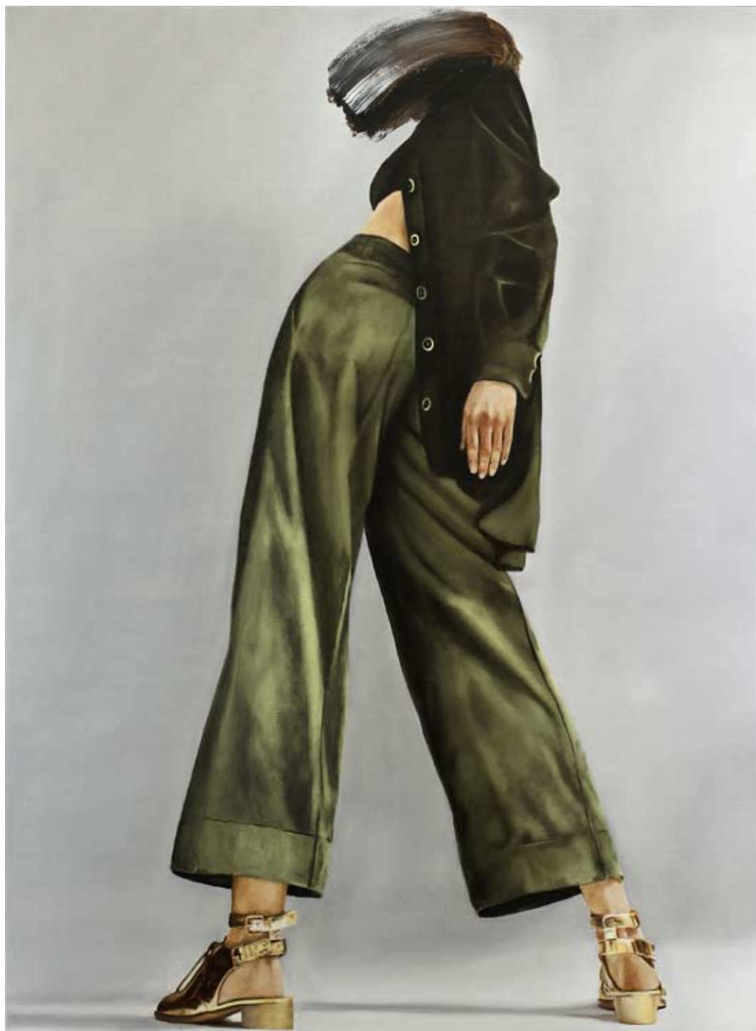
Idol/idol , 2018 Öl auf Leinwand oil on canvas 150 x 110 cm