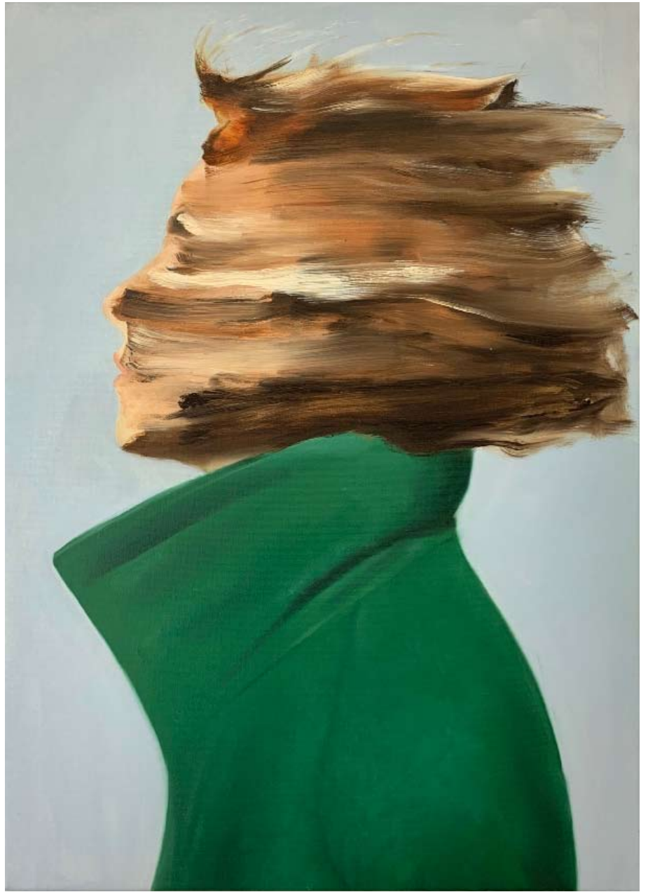
Model/model , 2019 Öl auf Leinwand oil on canvas 70 x 50 cm