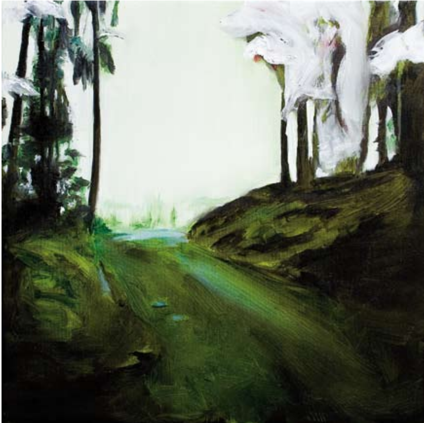
Blur/blur , 2016 Öl auf Leinwand oil on canvas 50 x 50cm