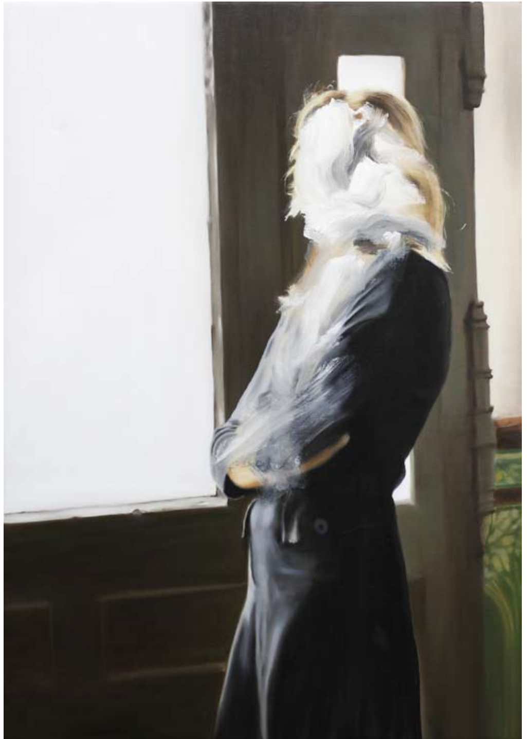
Schneegeruch/ smell of snow , 2017 Öl auf Leinwand oil on canvas 100 x 70cm