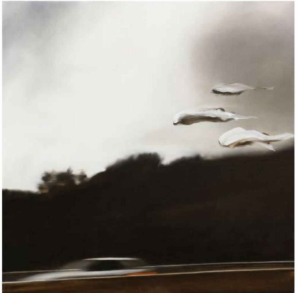
follow/follow , 2019 Öl auf Leinwand oil on canvas 70 x 70 cm