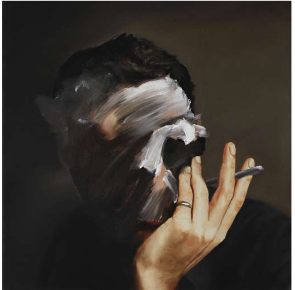
Model/model , 2019 Öl auf Leinwand oil on canvas 50 x 50 cm