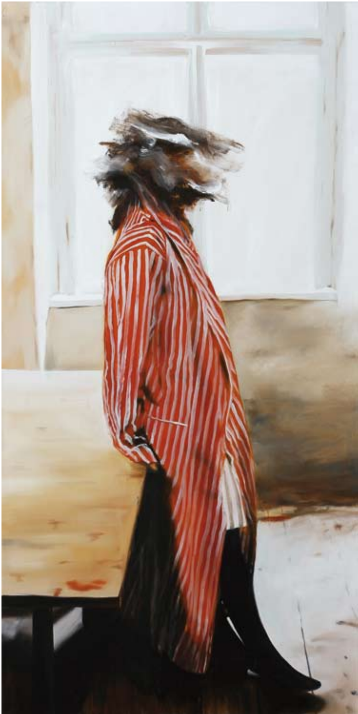
Morgenröte/ aurora , 2017 Öl auf Leinwand oil on canvas 200 x 100 cm