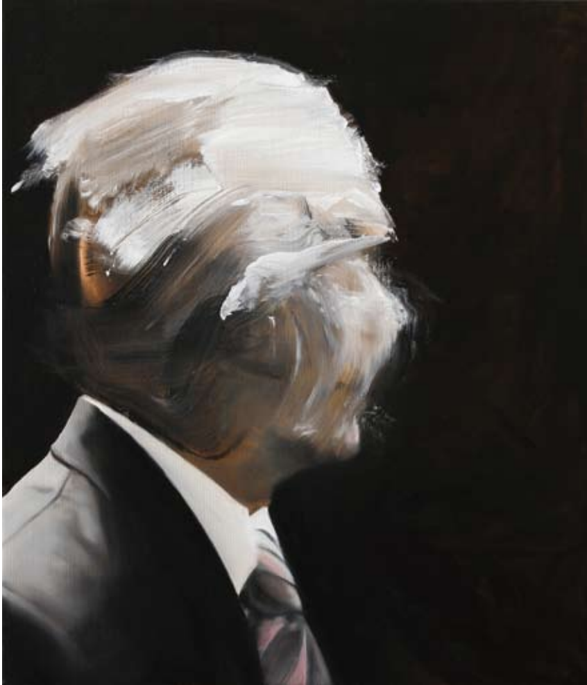
Schein/shine, 2017 Öl auf Leinwand oil on canvas 70 x 60 cm