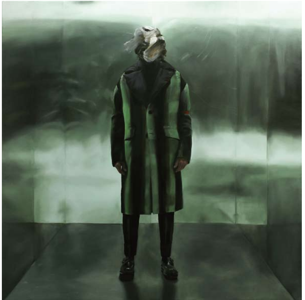
Idol (Auflösen)/idol (dissolve) , 2018 Öl auf Leinwand oil on canvas 200 x 200 cm