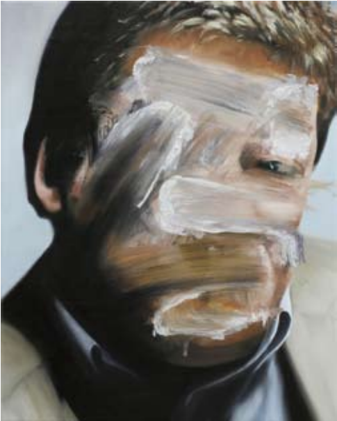
Model/model , 2018 Öl auf Leinwand oil on canvas 50 x 40 cm