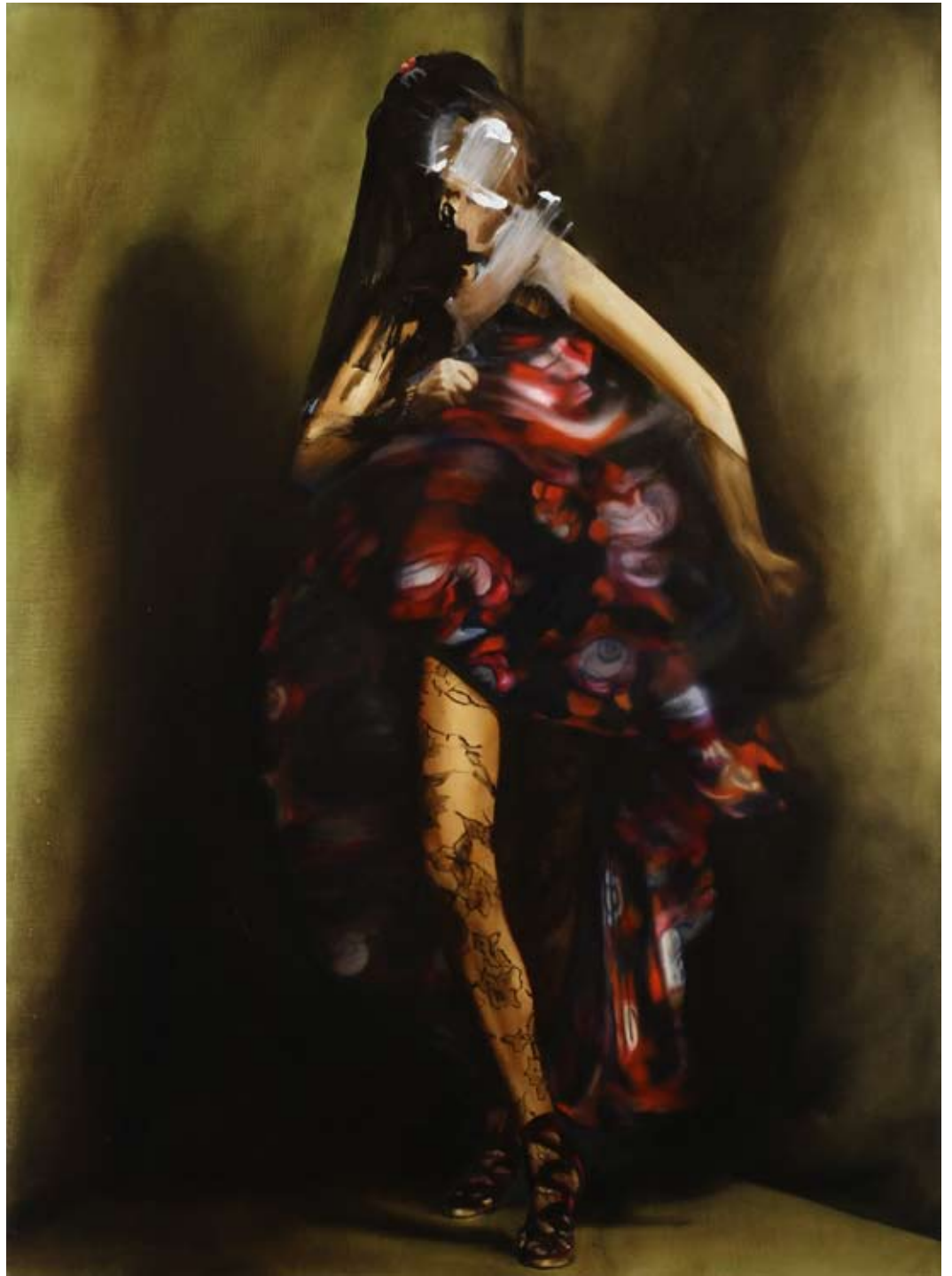
Idol/idol , 2019 Öl auf Leinwand oil on canvas 150 x 110 cm