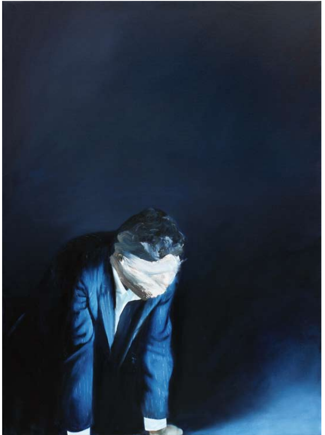
Plan/plan , 2017 Öl auf Leinwand oil on canvas 150 x 110 cm