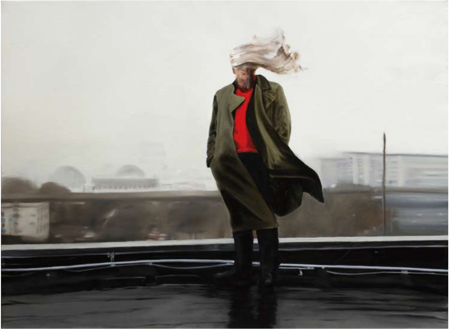
Westwind/west wind , 2017 Öl auf Leinwand oil on canvas 90 x 150 cm