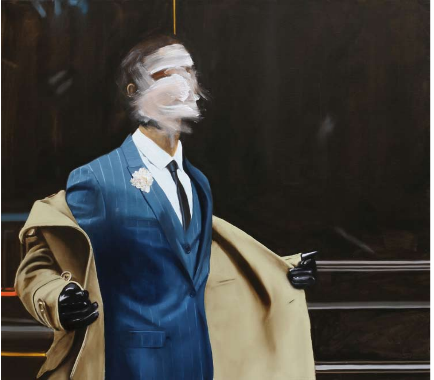
Erkennungszeichen/ identification mark , 2017 Öl auf Leinwand oil on canvas 150 x 130 cm