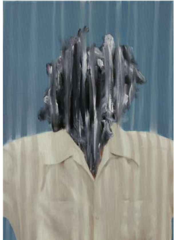
O.T. (Annehmen)/untitled (accept), 2017 Öl auf Leinwand oil on canvas 70 x 50 cm