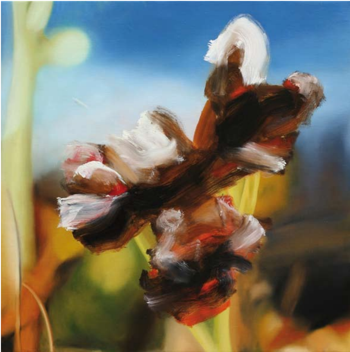
Wonderland/wonderland, 2017 Öl auf Leinwand oil on canvas 90 x 90 cm