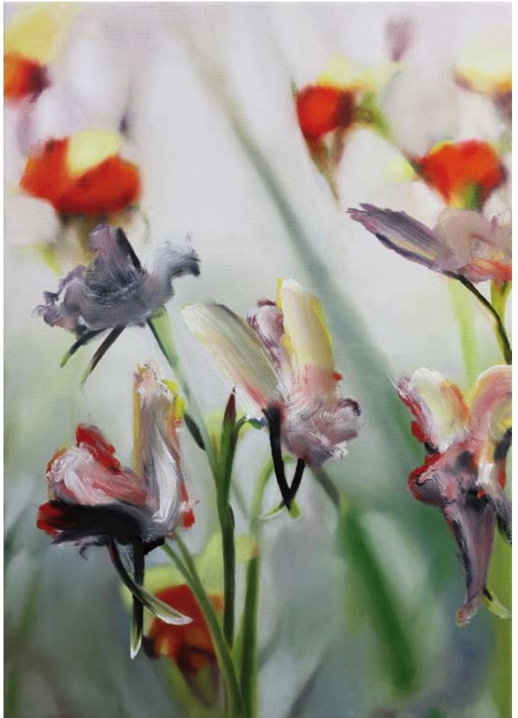
Wonderland/wonderland, 2017 Öl auf Leinwand oil on canvas 100 x 70 cm