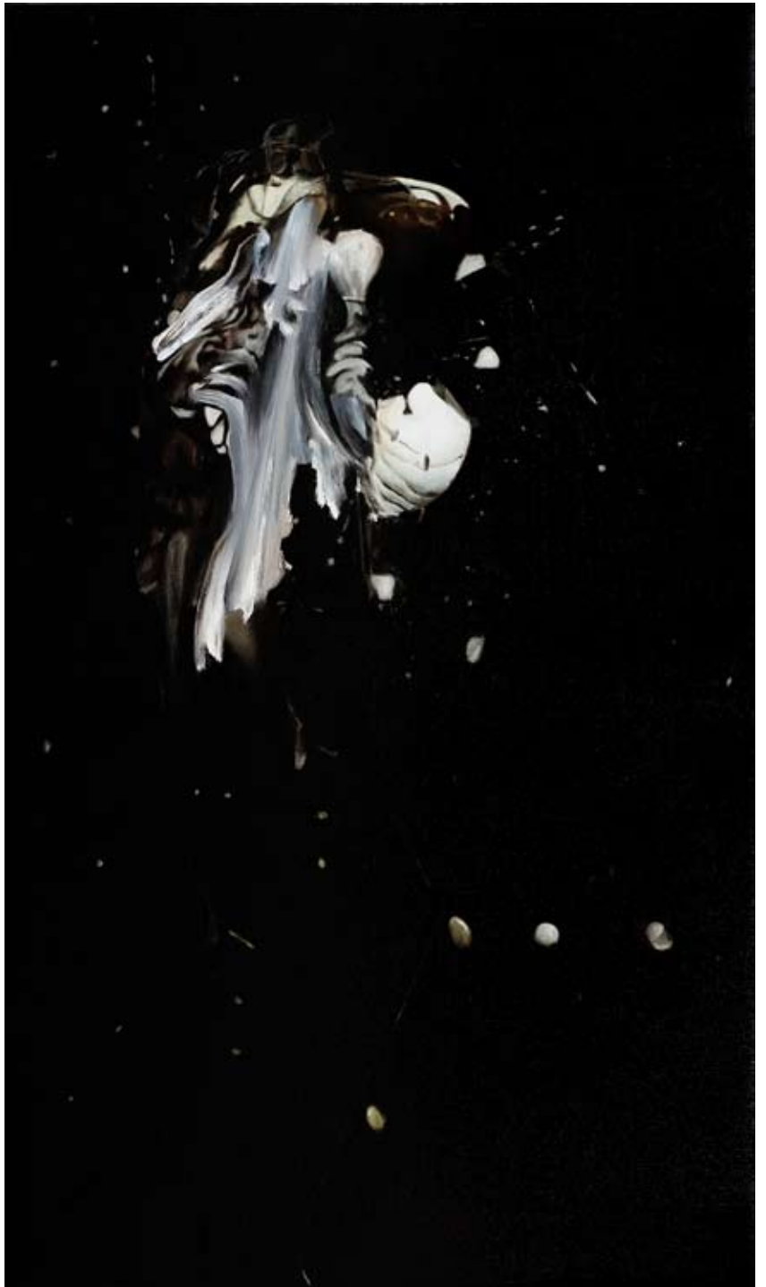
ein Gedanke manifestiert sich nicht/ a thought does not manifest , 2016 Öl auf Leinwand oil on canvas 90 x 120 cm