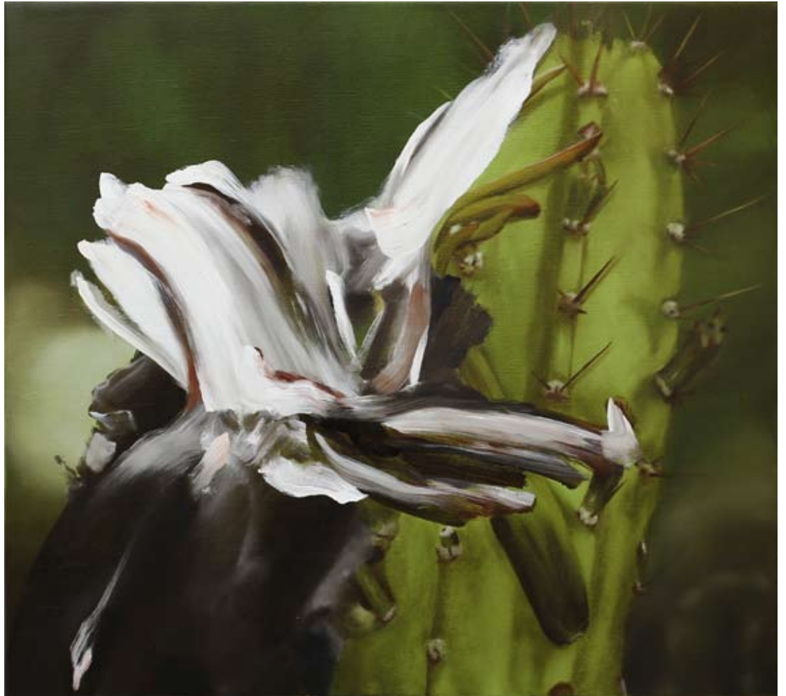
Wonderland/ wonderland , 2019 Öl auf Leinwand oil on canvas 90 x 100 cm