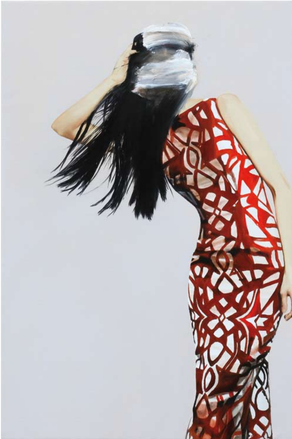
Idol/idol , 2018 Öl auf Leinwand oil on canvas 150 x 100 cm