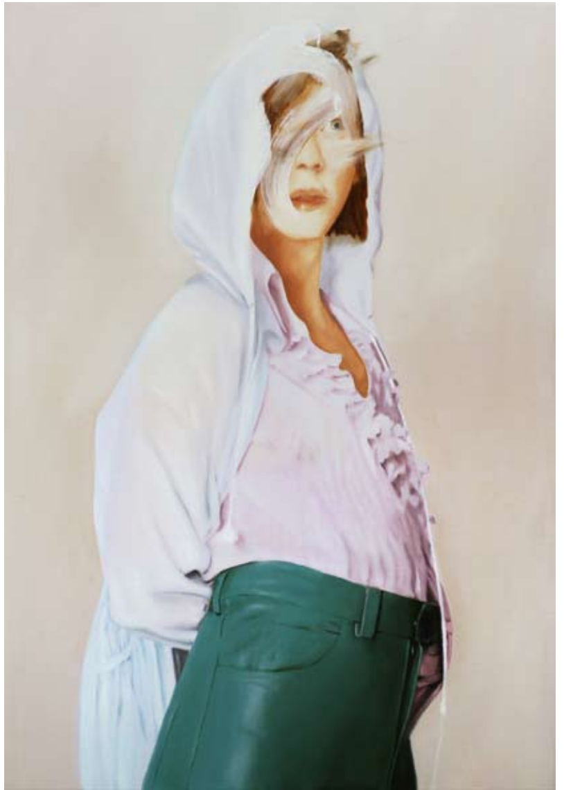
Model/model , 2018 Öl auf Leinwand oil on canvas 100 x 70 cm