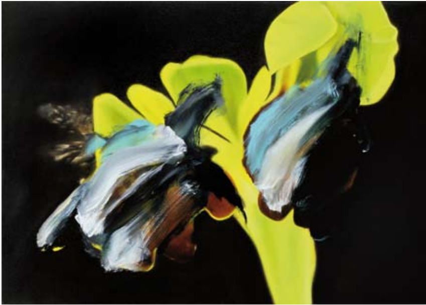
Wonderland/ wonderland , 2018 Öl auf Leinwand oil on canvas 50 x 70 cm