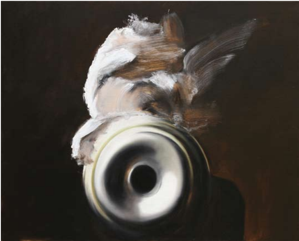
Ton/tone , 2017 Öl auf Leinwand oil on canvas 80 x 100 cm