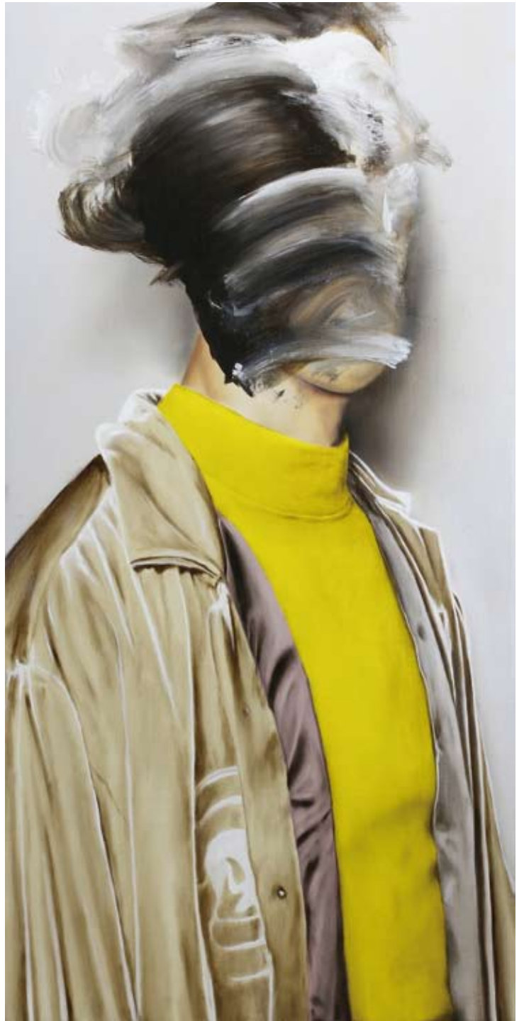
Model/model , 2018 Öl auf Leinwand oil on canvas 100 x 50 cm