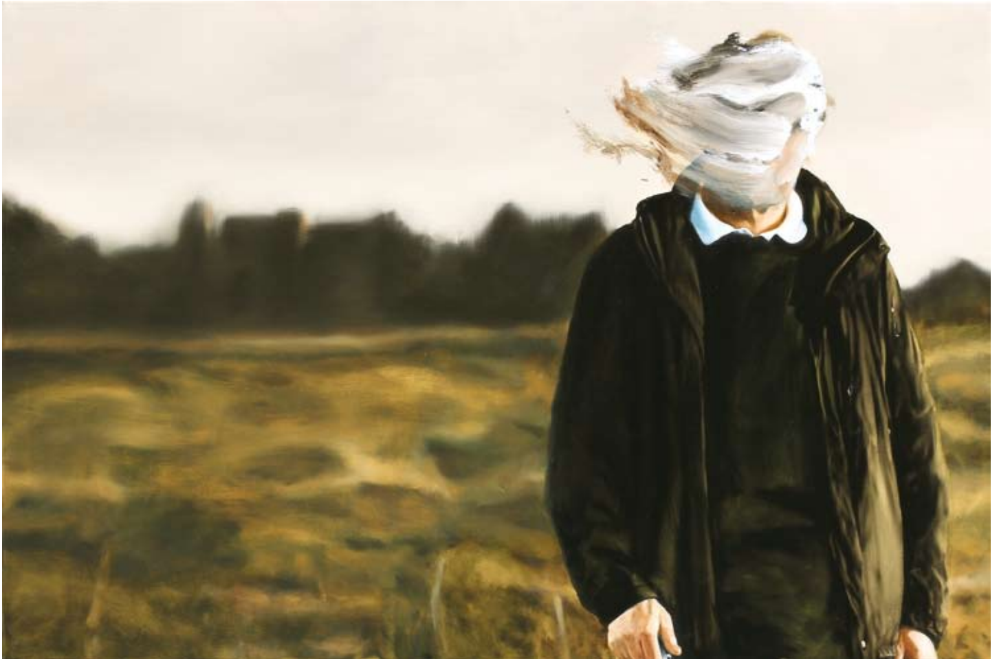
Adelshalle/ceremonial hall, 2018 Öl auf Leinwand oil on canvas 100 x 150 cm