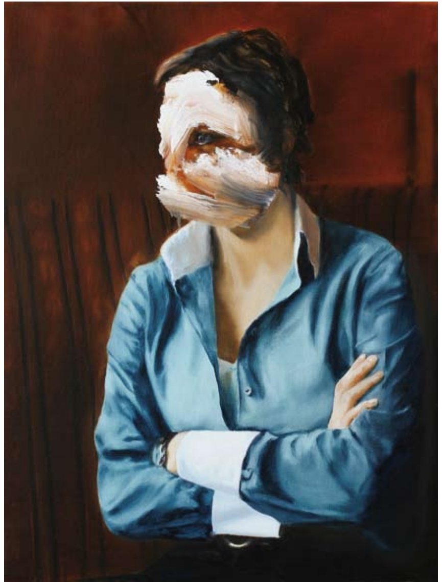
Frau Frosch/ Mrs. Frog , 2017 Öl auf Leinwand oil on canvas 80 x 60 cm