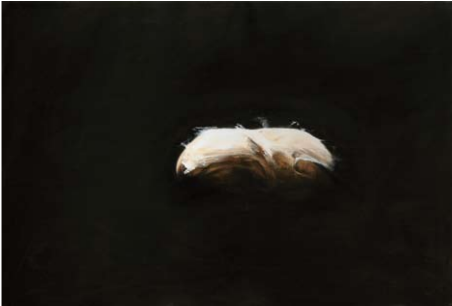
Nachdem ich mir das Wesen der Seele vorgestellt habe, kann ich sie mir nicht als viereckig denken/ After I have imagined the essence of the soul, I cannot think her as a square, 2017 Öl auf Leinwand oil on canvas 80 x 120 cm