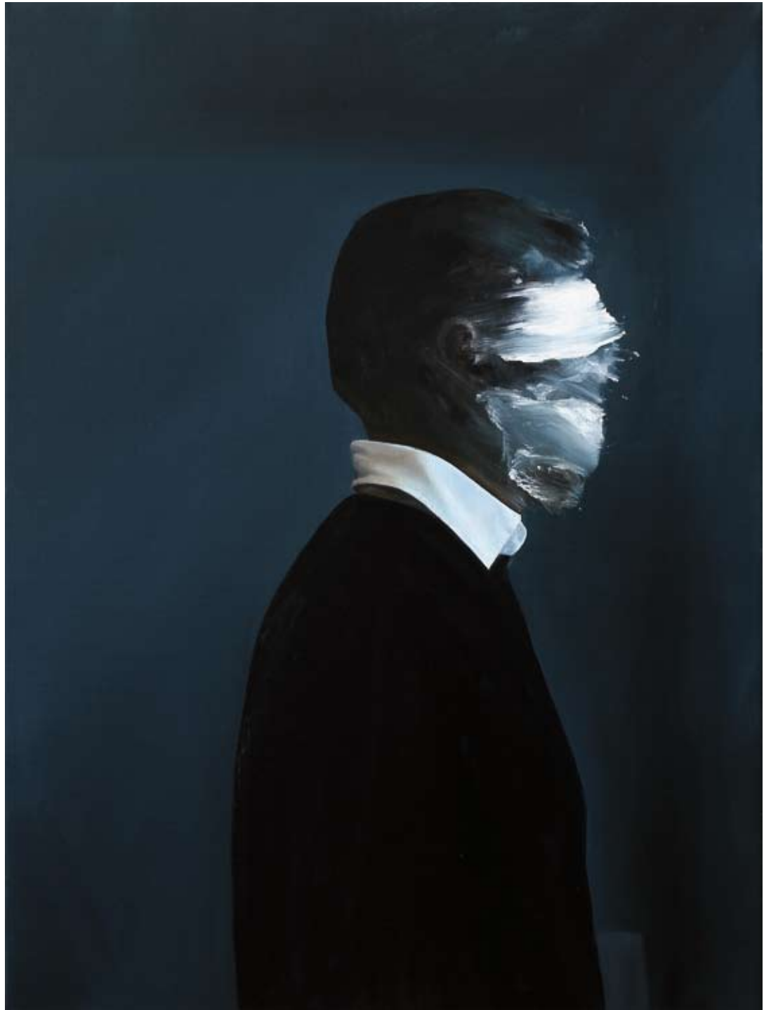
Idol (Warteraum)/ idol (waiting room) , 2017 Öl auf Leinwand oil on canvas 120 x 90 cm